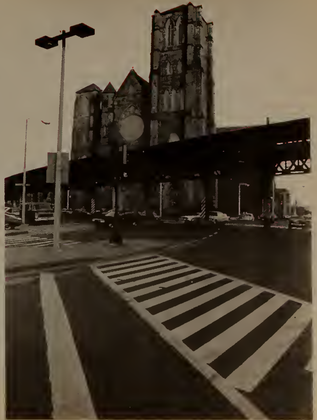
Holy Cross Cathedral

Los equipos de artistas y estudiantes pasan un día a la semana tomando foto-